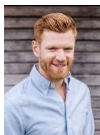
Ernst Christ Maler- und Gipserunternehmer- verband des Kantons Solothurn